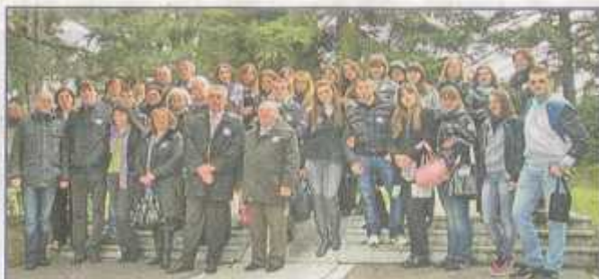
Следеће окупљање у Загребу 2011. године

— Мислим да су ови пројекти неопходни јер помажу да се млади уче на грешкама старијих, да се „отворе“, повежу и остваре контакте. Кад једног дана постану угледни стручњаци